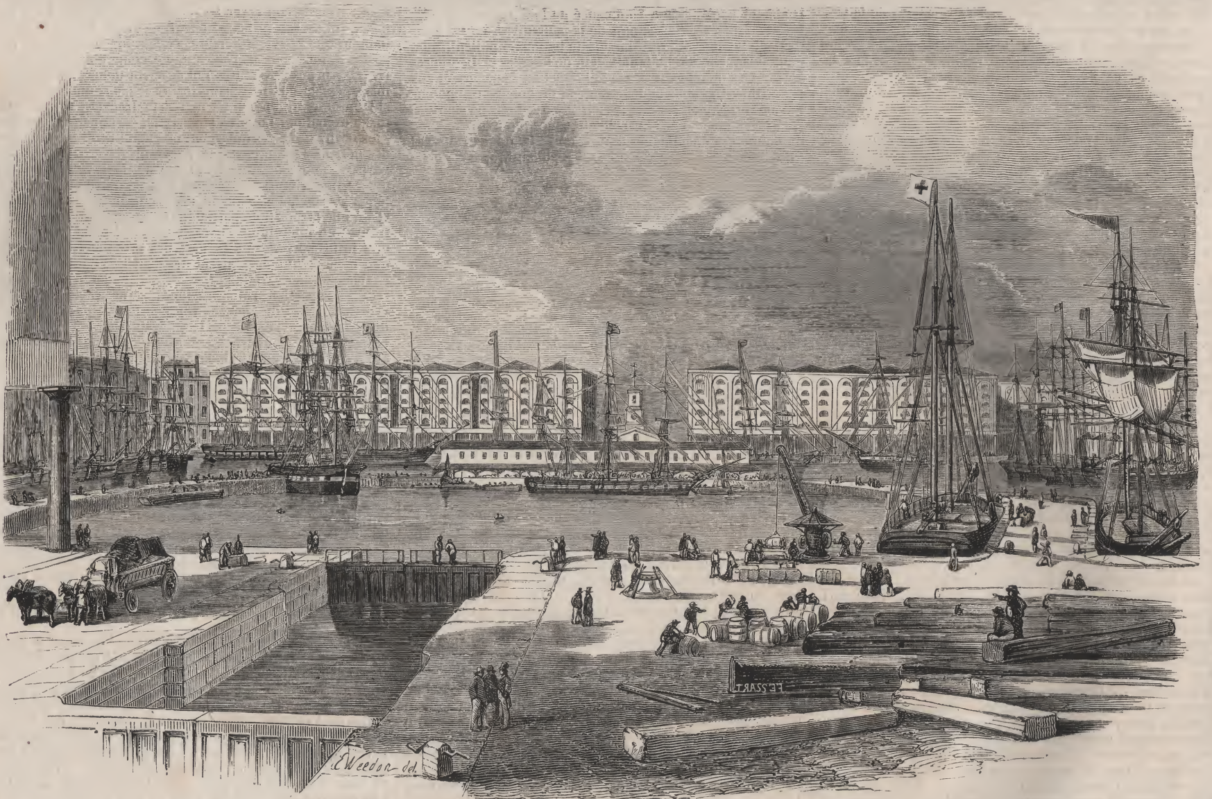
Lock de Sainte-Katherine.