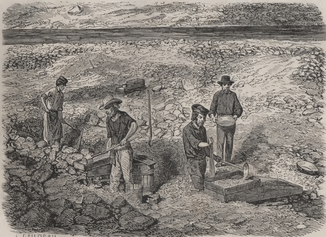
Colonie de mineurs à Mariposa.

été prédestinés à perdre les grâces et les charmes naturels pour ne présenter à l'œil affligé que les traces, rien moins qu'aimables, de l'avidité du mineur, pour qui la nature n'a là qu'une seule beauté : son or.