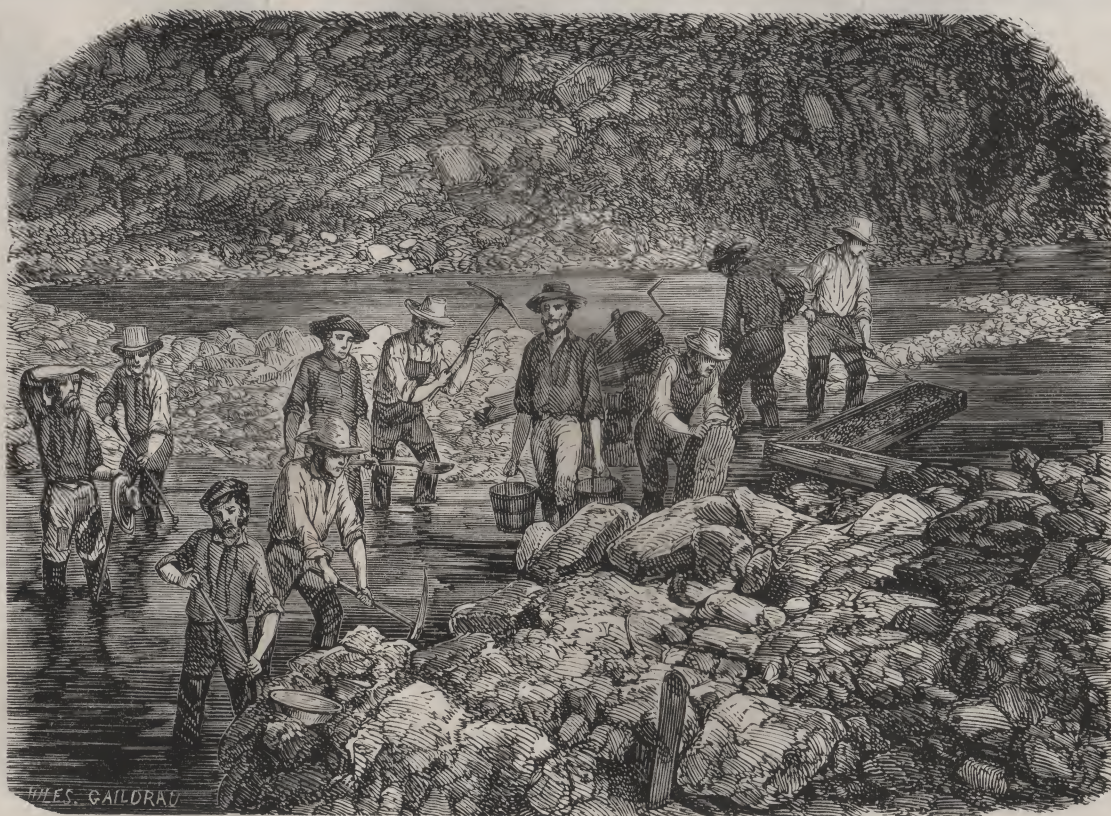
Travaux de détournement de Bedwell-River.

« On peut dire que, dans ces régions privilégiées, la terre est saturée d'or. On l'y trouve souvent sans le chercher, rien qu'en semant des pommes de terre, ou en enfonçant les pieux des tentes. Elle paye partout, suivant le dictionnaire local. Les mineurs, campés et groupés au milieu de leurs premières fouilles, s'étendent ensuite tout à l'entour, et changent en fondrières tous ces sites naguère si riants; ces sols bouleversés semblent avoir