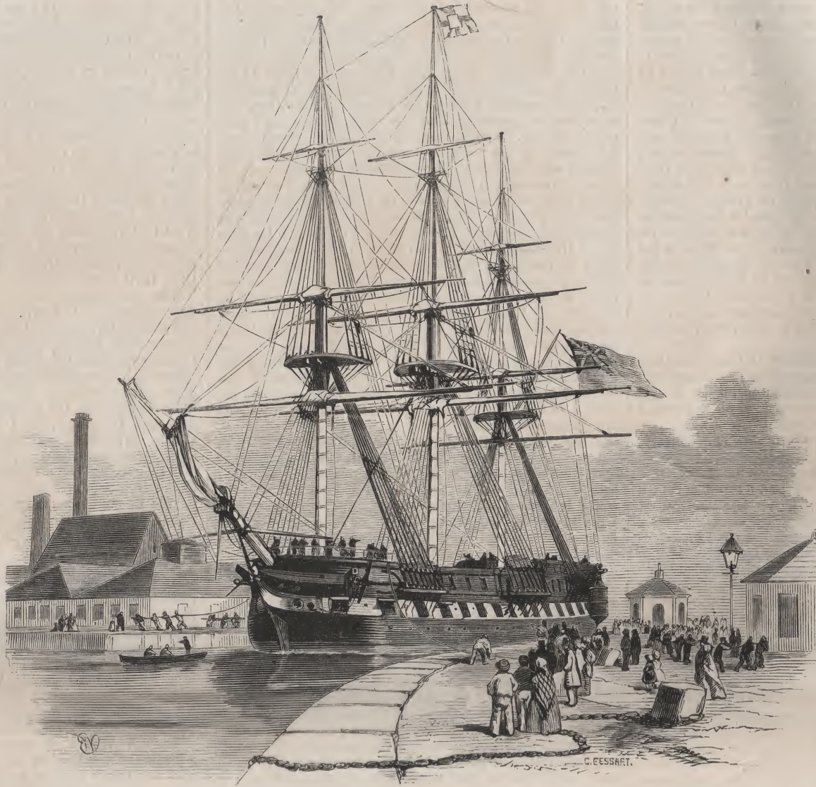
Vaisseau de la Compagnie des Indes, remorqué dans les docks de la Tamise.

La hauteur des magasins et leur proximité des bassins donne à ces docks une apparence resserrée. Le lit des bassins, quoique moindre que celui des autres docks, donne, comparativement, un plus grand