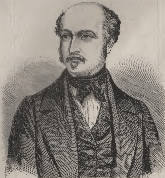
Le capitaine J. A. Sutter.

« L'or trouve sous les pieds du capitaine Sutter l'eût vite enrichi, et les terrains qu'il a possédés l'eussent fait cent fois millionnaire aux prix fabuleux qu'ils ont atteints; mais, animé de sentiments