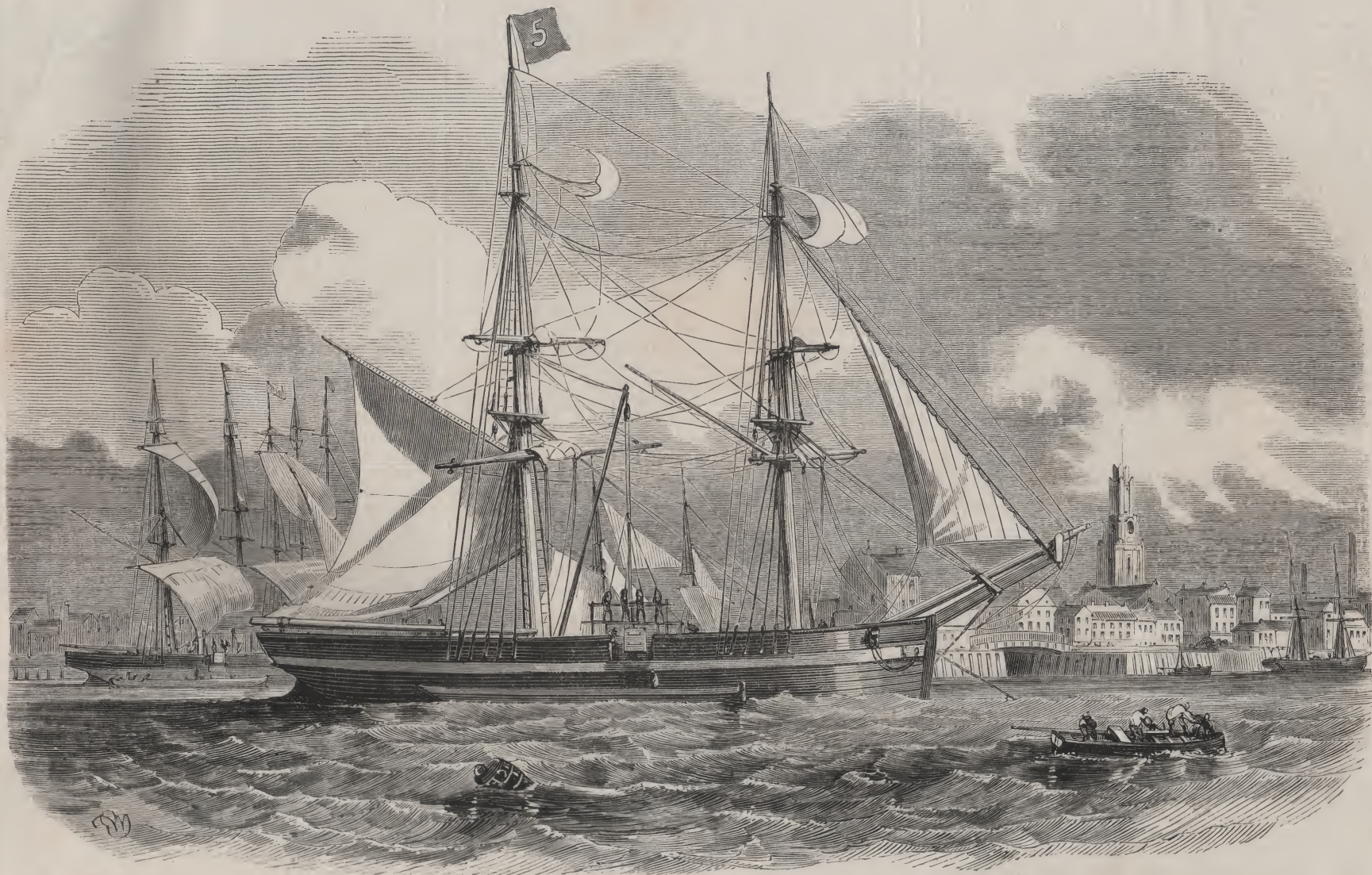
Bâtiment charbonnier déchargeant son charbon.

(London Docks), dont nous venons de parler, occupent une superficie d'environ 100 acres. Ils peuvent recevoir commodément 500 bâtiments. Les magasins sont disposés pour 235,000 tonnes de marchandises. Le tabac est un des principaux articles qui s'entreposent dans ces docks. Les magasins affectés à ce seul objet couvrent une étendue superficielle de cinq acres et peuvent contenir 25,000 boucauts de tabac. Les caves renferment 60,000 pièces de vin; l'une d'elles s'étend sur une surface de 7 acres. Les magasins sont moins bien combinés que dans les docks précédents; ils sont éloignés du bassin, en sorte que les marchandises ne peuvent être élevées et transportées par une même opération dans les magasins.