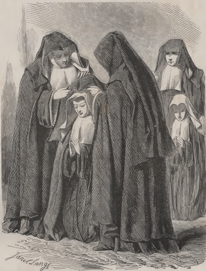
La prise du voile.

« Au nom du père, du Fils et du Saint-Esprit; ainsi soit-il. Je jure... me voue et promets à Dieu, à la bienheureuse vierge Marie, au glorieux Jean-Baptiste, à notre bienheureux père saint Augustin, nos patrons, et généralement tous