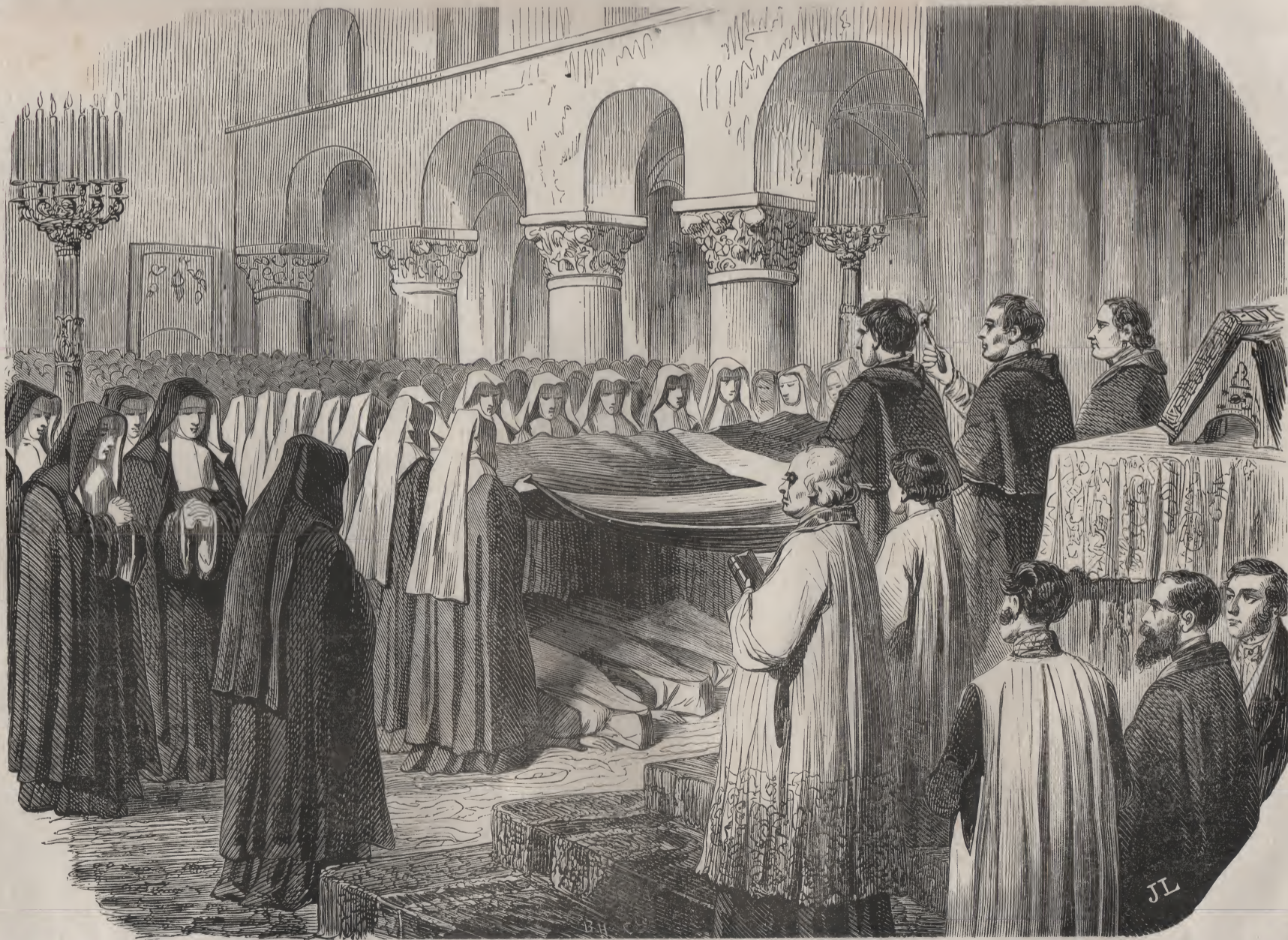
Les professes recouvertes du drap mortuaire.