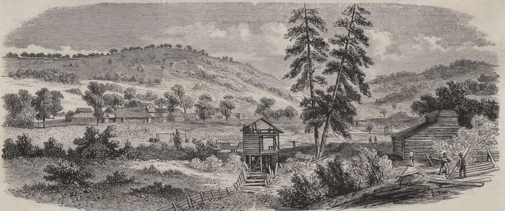
Scierie Sutter et cité de Coloma.

« Le territoire entier de la ville de Sacramento ( Nouvelle-Helvétie ), celui où est bâtie Marysville , les plaines de Sonoma , les Buttes , la Bodega , tout était à lui en vertu des meilleurs titres : Cession régulière des propriétaires originaires, acquisition, conquête par l'industrie et le travail, rien ne manquait... et il a tout laissé partir, pendant que, des mielles tombées de sa table, ses convives s'enrichissaient. Sans doute il est resté quelque chose au capitaine Sutter : Nock-farm , sur la rivière la Plume , est une magnifique résidence. Là sont concentrés les biens les plus réels de monde : la famille et cette juste et immense considération qui font aimer, admirer et respecter de tous John Sutter, qui porte la foule sur ses pas et fait un événement de sa présence dans toutes les réunions publiques. Le voyageur se découvre en passant devant cette résidence, où l'on est toujours sûr d'un accueil si hospitalier. Que de souvenirs et d'émotions n'ai-je pas emportés des moments passés avec lui ! C'est une histoire vivante que cette conversation, qu'il peut entretenir dans tous les idiomes, sur la Genèse de cette Californie grandie si vite. Je ne parle pas du bien-être matériel qu'on trouve dans cette oasis. Rien n'y est épargné pour bien accueillir le visiteur arrivé de si loin. Le vin des meilleurs coteaux de Reims et d'Aï y coule