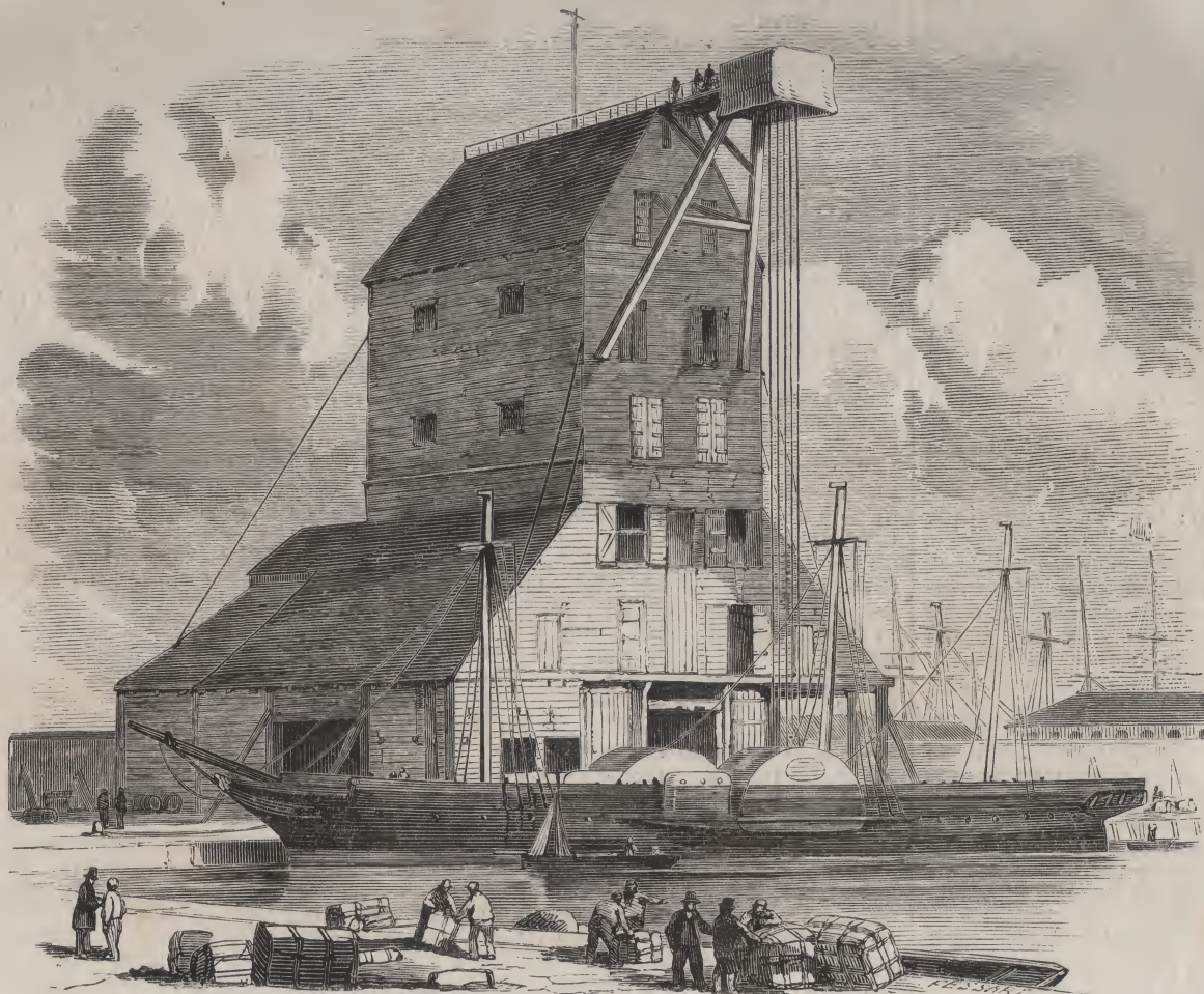
Machine à mâter. — Dessins de M. Edwin Weedon.

Le transport des charbons par mer a sensiblement diminué dans ces dernières années, à cause de la concurrence des chemins de fer. Ce trafic, qui, pour les chemins de fer, s'é-